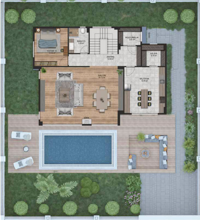
ZEMİN KAT PLANI