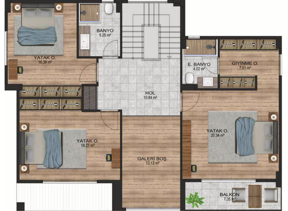
1. KAT PLANI